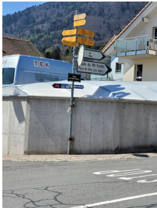
Photo 3 Départ du Mont-Tendre