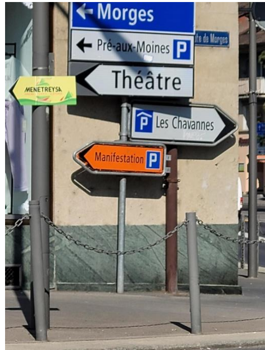
Photo 1 : Giratoire de Cossonay, accès au parking du Pré-aux-Moines